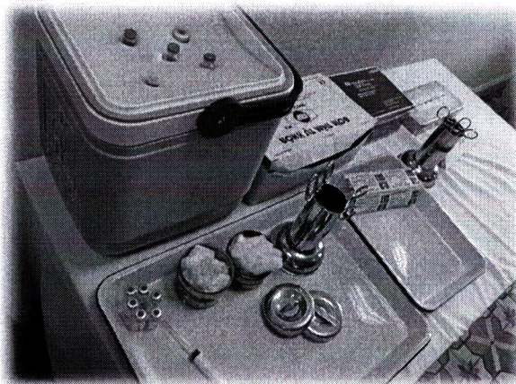
Hình 1. Hình ảnh bàn tiêm chủng